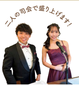
二人の司会で盛り上げます！

この場で誓った決意を胸に、今後も一丸となり、お客様の期待を超えるサービス提供に努めてまいります。