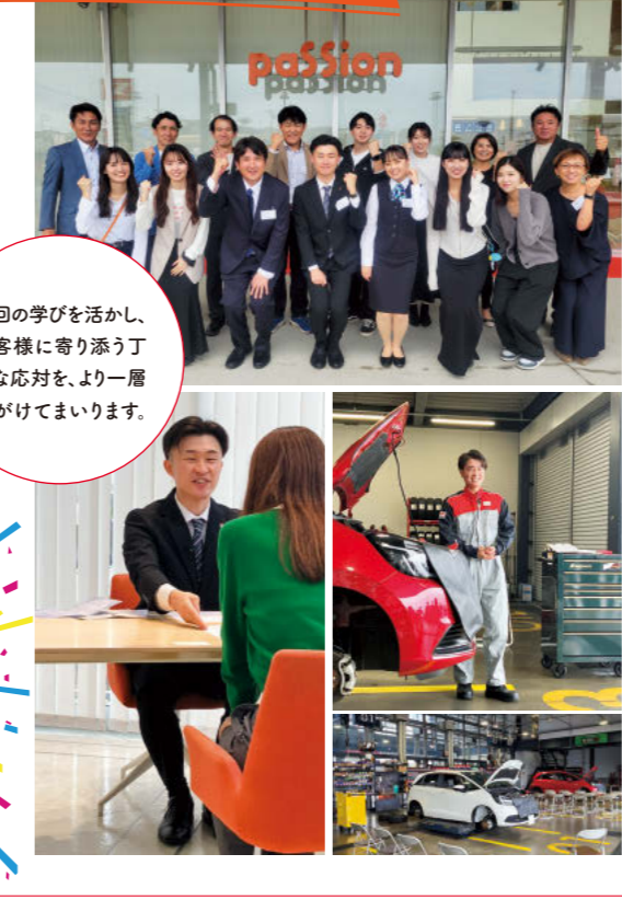
今回の学びを活かし、お客様に寄り添う丁寧な応対を、より一層心がけてまいります。