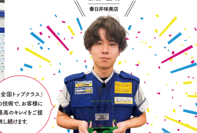
「全国トップクラス」の技術で、お客様に最高のキレをご提供し続けます。