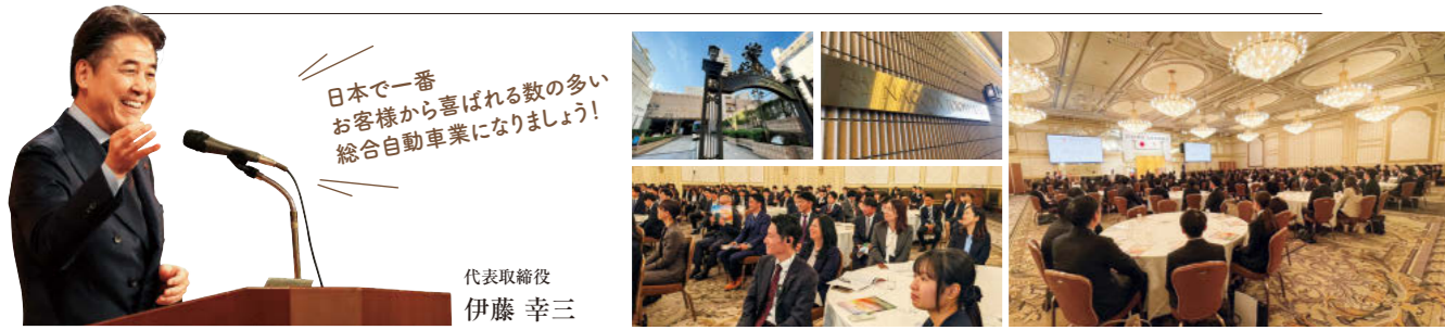
日本で一番お客様から喜ばれる数の多い総合自動車業になりました！