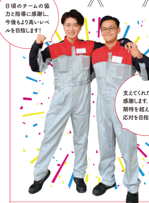
日頃のチームの協力と指導に感謝し、今後より高いレベルを目指します！